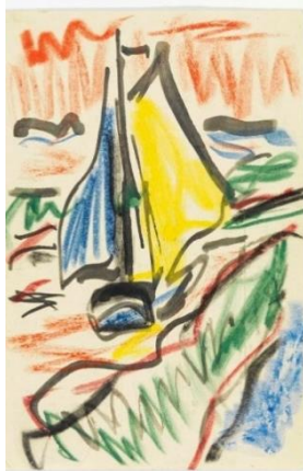
Karl Schmidt-Rottluff, Segelboot an der Küste, um 1910 Brücke-Museum, Berlin

„Von rauschenden Farben“ ist das Leitthema für vier Einheiten, die einzeln oder auch in Kombination als Workshop miteinander gebucht werden können.