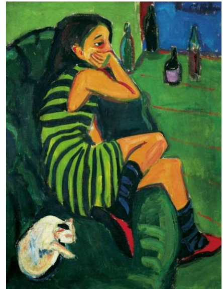
Ernst Ludwig Kirchner, Artistin Marcella, 1910 Brücke-Museum, Berlin