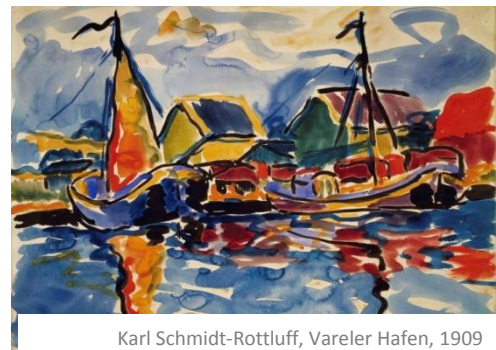
Karl Schmidt-Rottluff, Vareler Hafen, 1909 Brücke-Museum, Berlin

Auf großen Formaten experimentieren wir mit Aquarell-Farben.