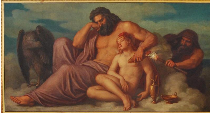
Bild links der Venusdarstellung Prometheus stiehlt dem schlafenden Zeus das Feuer. In den Armen des Zeus ruht der entführte Knabe Ganymede mit seinem Attribut, dem Kelch, den er in seiner Funktion als Mundschenk benötigt. Links hockt der Adler, Zeus' Erkennungstier.

Bild über der Venusdarstellung Die Göttin Athene schenkt den von Prometheus aus Lehm geformten Menschen das Leben (Unklar ist, was die Göttin in der Hand hält, um Leben zu schenken)