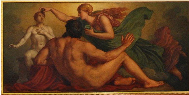
Bild über der Venusdarstellung Die Göttin Athene schenkt den von Prometheus aus Lehm geformten Menschen das Leben (Unklar ist, was die Göttin in der Hand hält, um Leben zu schenken)