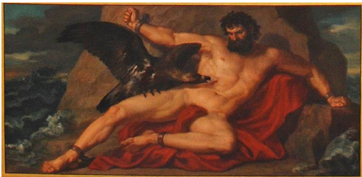
Bild unterhalb der Venusdarstellung Prometheus Strafe Der unbeugsame Prometheus ist an einen Felsen des Kaukasus geschmiedet und ein von Zeus gesandter Adler frisst an seiner stets in der Nacht nachwachsenden Leber.

Bild links der Venusdarstellung Prometheus stiehlt dem schlafenden Zeus das Feuer. In den Armen des Zeus ruht der entführte Knabe Ganymede mit seinem Attribut, dem Kelch, den er in seiner Funktion als Mundschenk benötigt. Links hockt der Adler, Zeus' Erkennungstier.