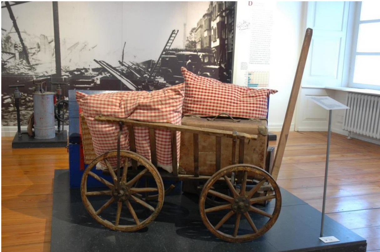
Handwagen, 1930er Jahre, Landesmuseum Kunst & Kultur Oldenburg, Inv. LMO 22.684, Foto: Sven Adelaide

Ort: Landesmuseum Kunst & Kultur Oldenburg, Schloss, Schlossplatz 1, 26122 Oldenburg