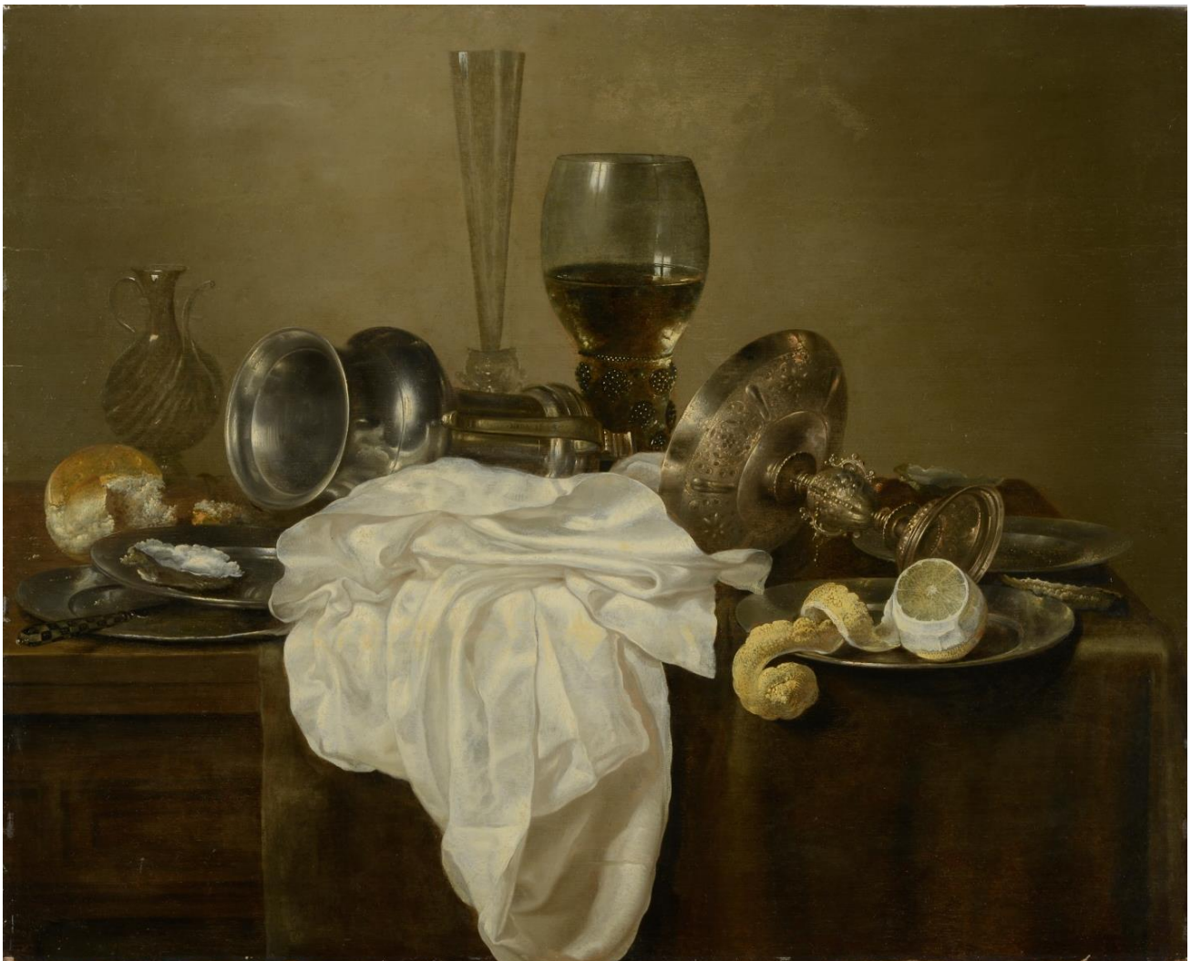
Willem Claesz. Heda (1594–1680), Frühstücksstilleben, 1645, Öl auf Holz, Landesmuseum für Kunst und Kulturgeschichte Oldenburg, Inv. 16.696

Ort: Augusteum, Elisabethstraße 1, 26122 Oldenburg